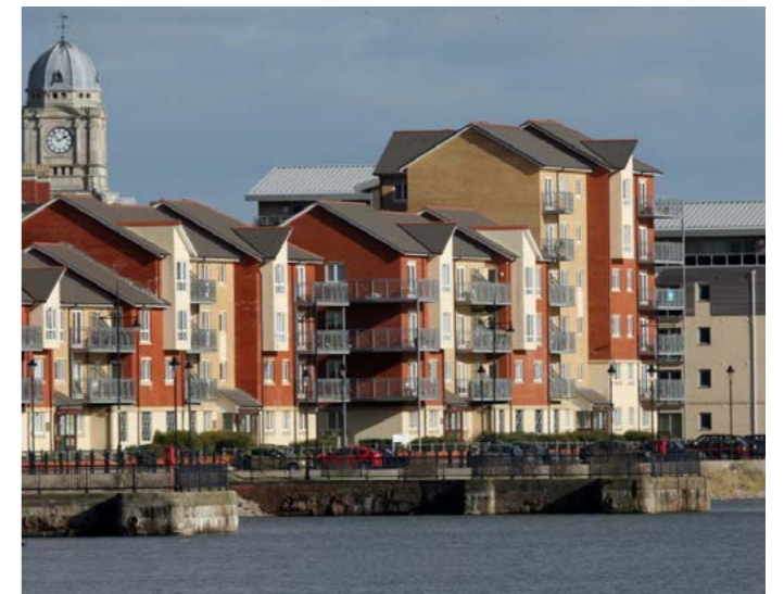
Datblygiad y Glanau