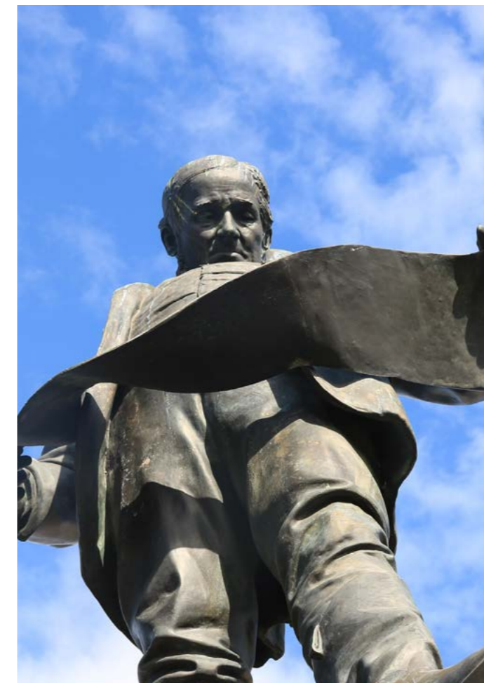
Cerflun David Davies gan Alfred Gilbert RA