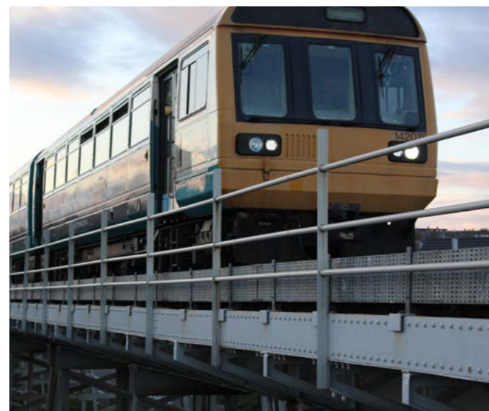
Trên Trafnidiaeth Cymru yn y Barri