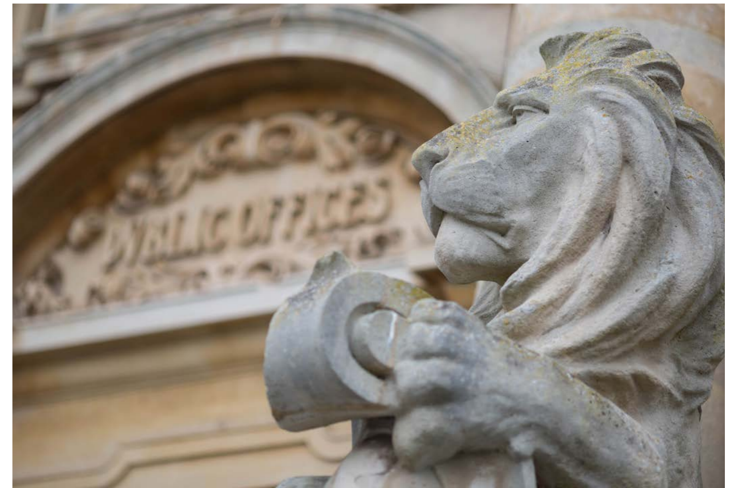
Manyl yn cerflun llew ar Neuadd y Dref y Barri