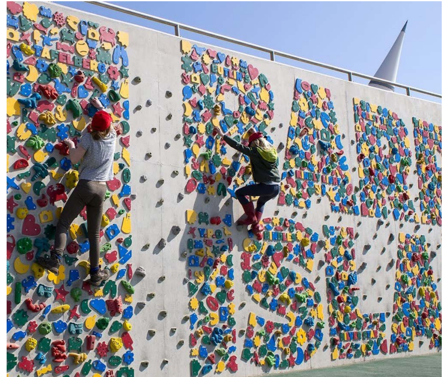
Wal ddringo, Promenâd Ynys y Barri

Mae newidiadau mewn arferion siopa a cholli manwerthwyr cenedlaethol wedi cyfrannu at y dirywiad hwn. Mae yna hefyd ddiffyg llais ar y cyd cryf i fusnesau lleol, sy'n ei gwneud hi'n anoddach ymateb i heriau.