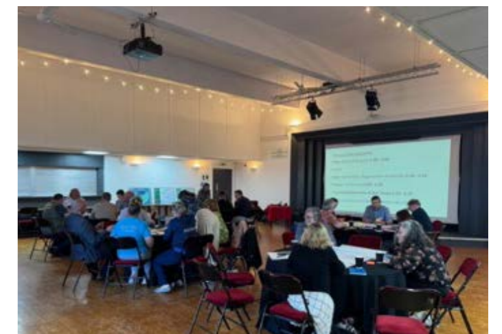
Digwyddiad ymgysylltu â'r cyhoedd yn y Memo'