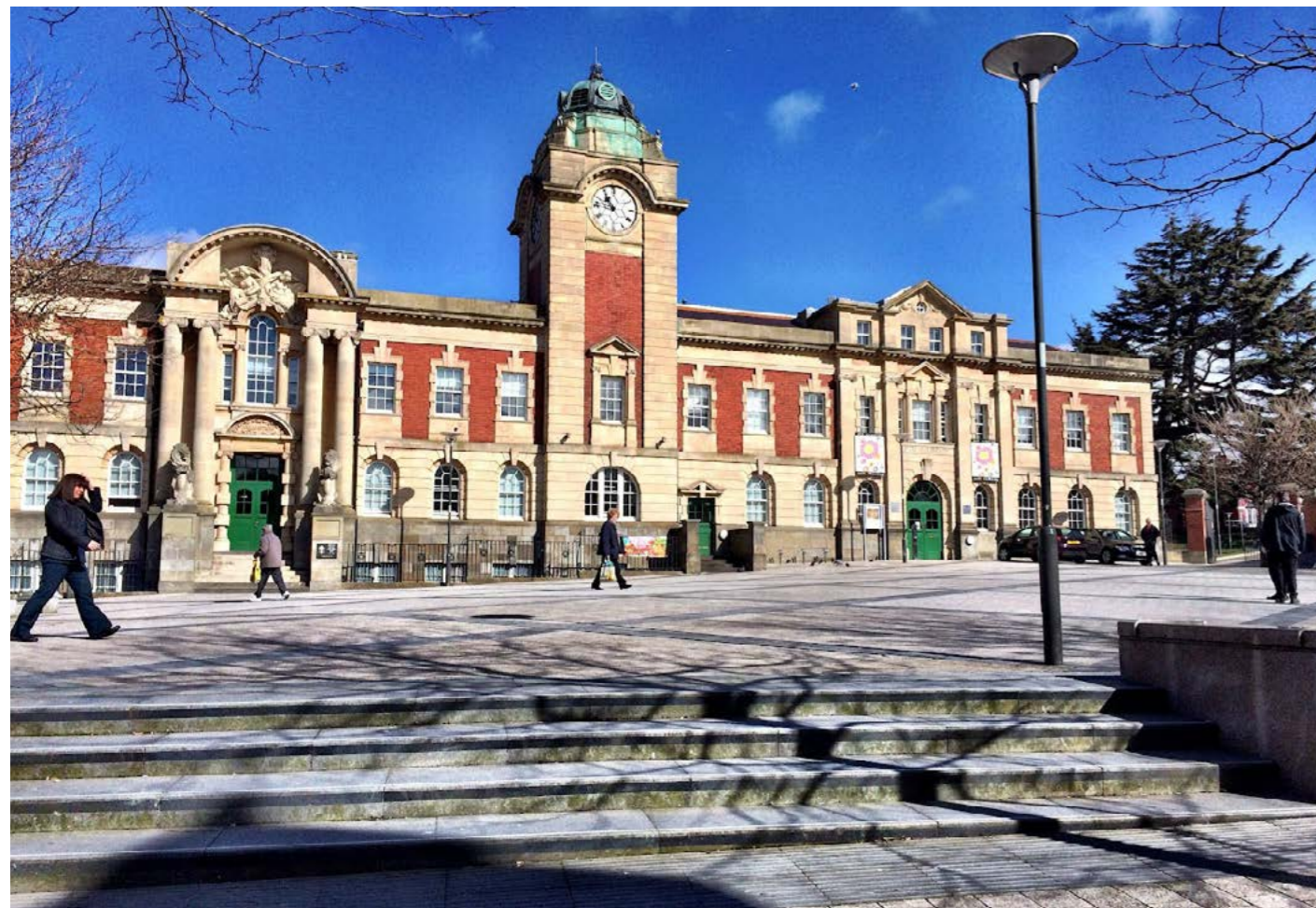
Neuadd y Dref y Barri a Sgwâr y Brenin

Maent yn dod â phobl a sefydliadau lleol ynghyd i ddatblygu syniadau a chefnogi prosiectau.