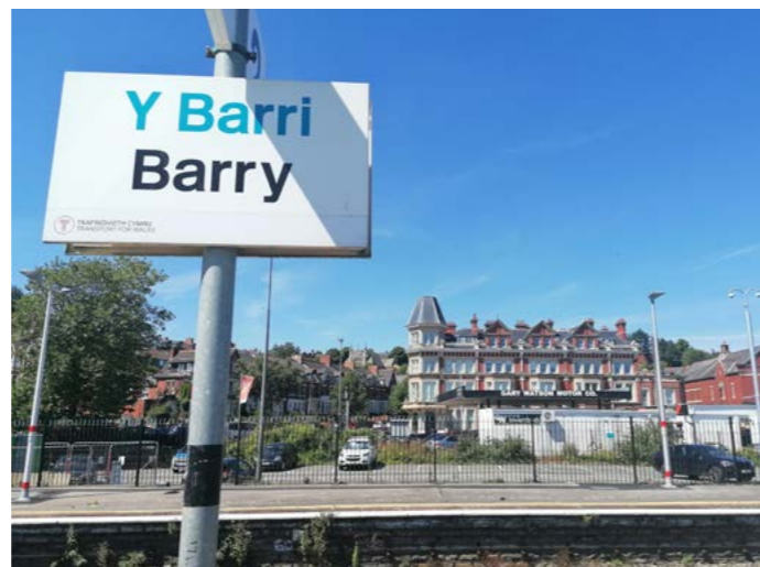
Delweddau cerdyn post o Eglwys Sant Cadog a Heol Golwg y Doc, a gorsaf drenau y Barri