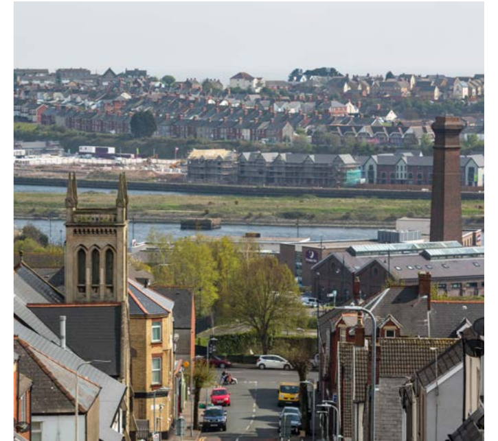
Golygfa i lawr Stryd y Drindod

Ar yr un pryd, mae pryderon ynghylch iechyd a heneiddio'n dda, yn enwedig mewn ardaloedd mwy difreintiedig.