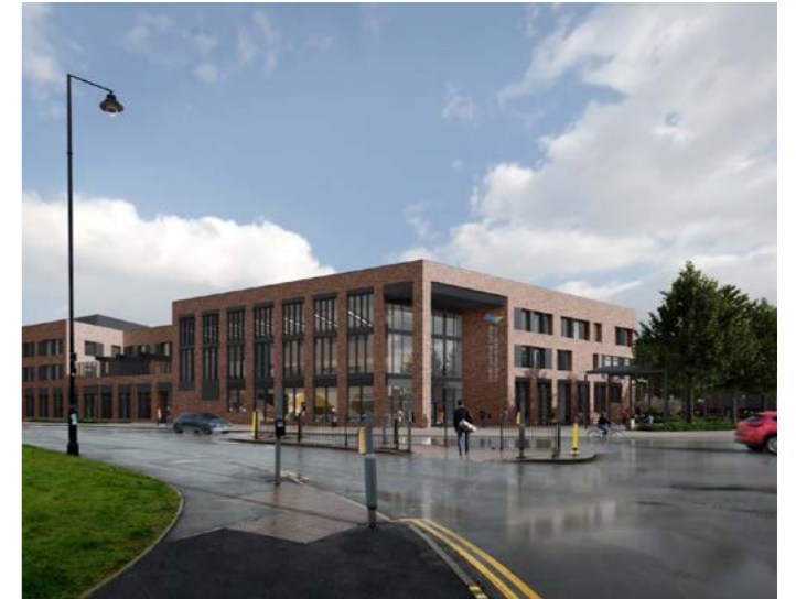
Campws Glanau'r Barri (CCAF)

Bydd ffocws hefyd ar gynaliadwyedd hirdymor. Bydd rhai prosiectau yn cynhyrchu incwm neu'n lleihau costau yn y dyfodol fel bod buddiannau yn parhau y tu hwnt i oes y cynllun.