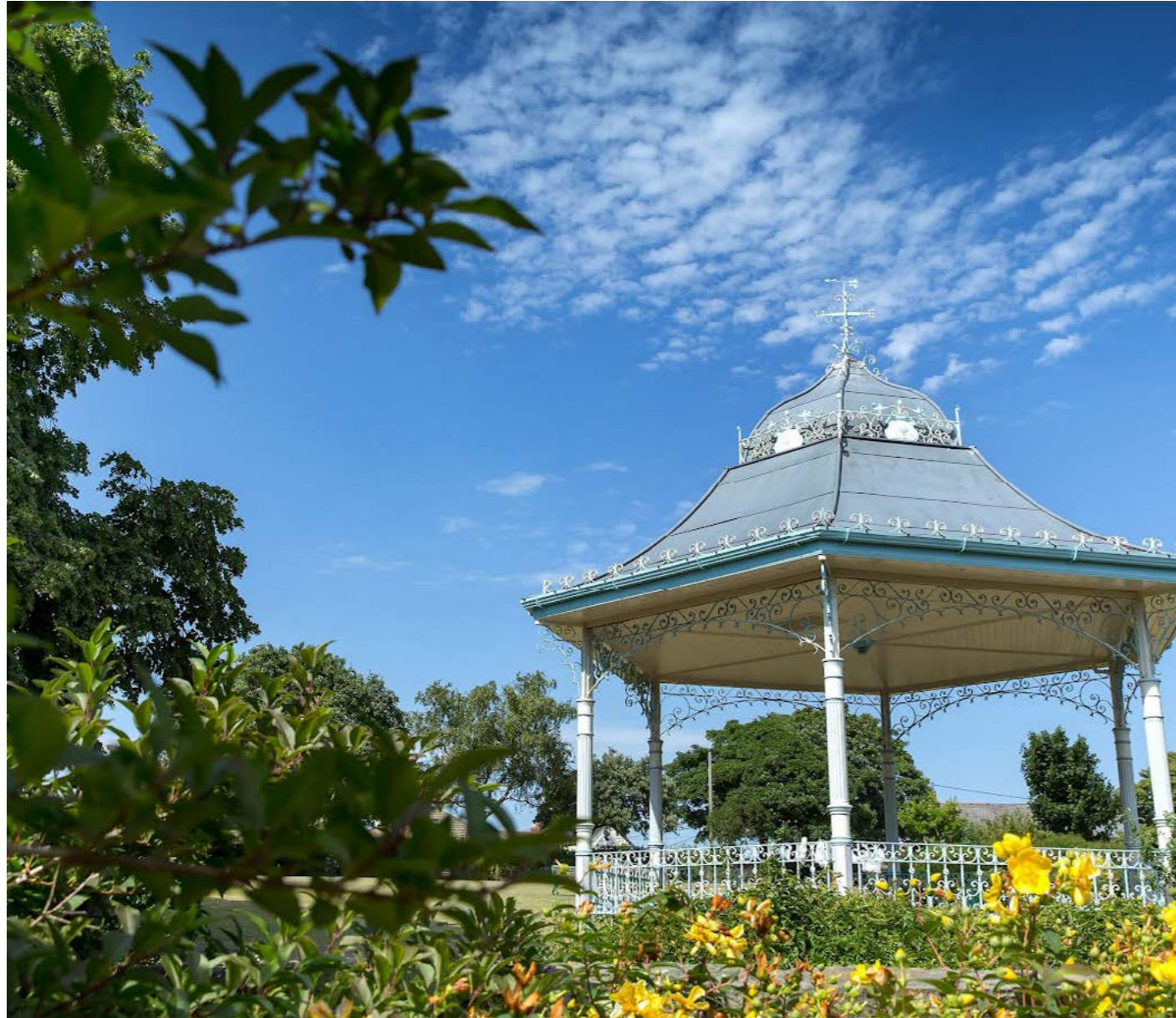
Standin Band ym Mharc Victoria, Tregatwg