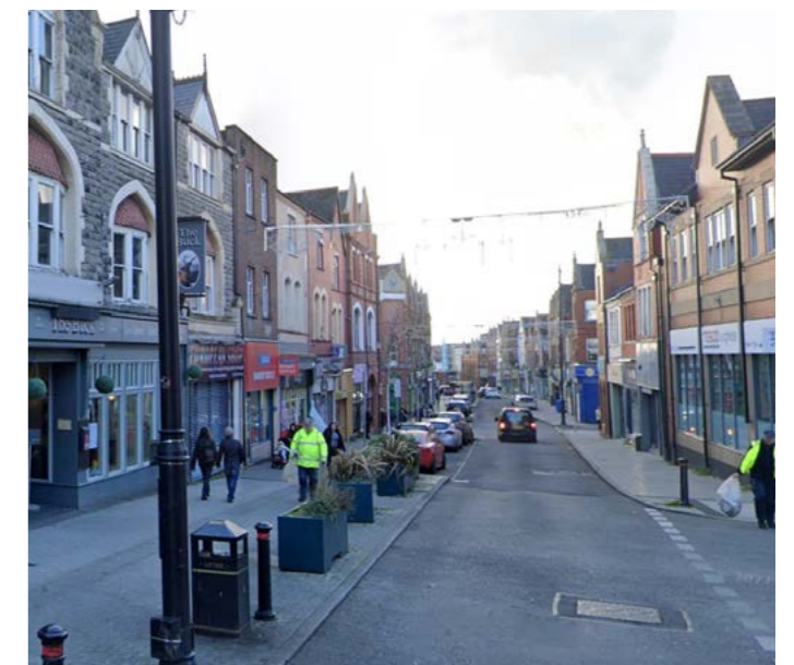
Golygfa i lawr Heol Holtwn