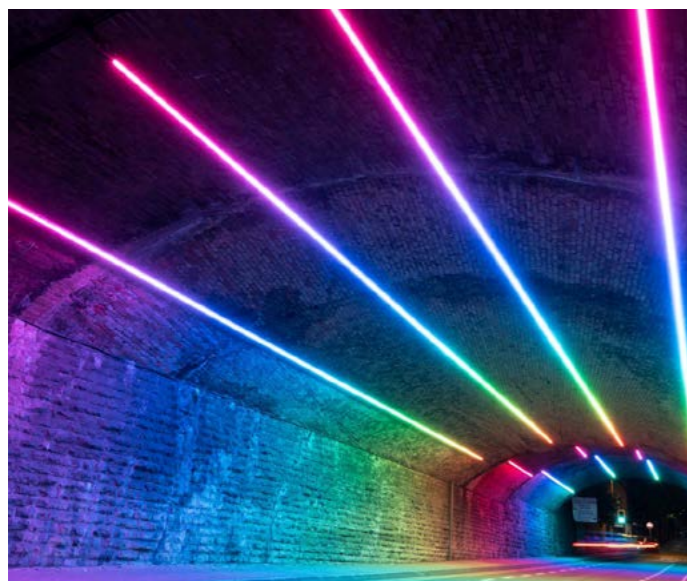
Gosodiad golau twnnel Heol Hood (Llif) a gynlluniwyd gan Jessica Lloyd-Jones mewn cydweithrediad ag Architainment